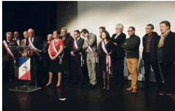
L'ensemble des membres du conseil municipal pendant l'allocution de Monsieur le Maire.