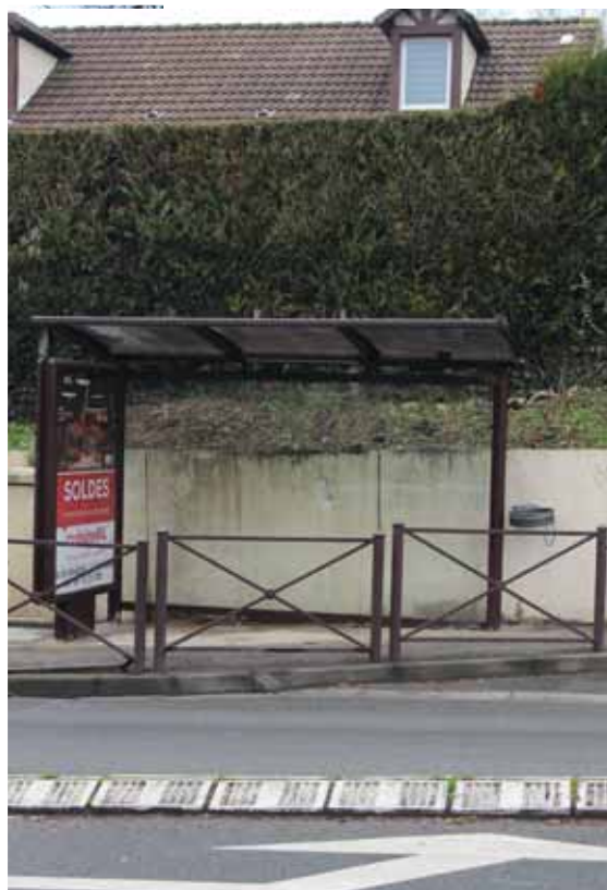
De nouveaux abris-voyageurs ont été installés courant du mois de janvier.

réalisés, des panneaux qui pour la plupart ont repris la place qu'ils occupaient en septembre. Ce marché permet à la commune de bénéficier gratuitement de nouveaux équipements supplémentaires, sans dépenser un centime d'argent public. Pour chaque panneau, une face ville est destinée à l'affichage culturel et d'informations de la ville ; l'impression et la pose des affiches sont gratuites. Nous allons aussi avoir de nouveaux abris-voyageurs, des panneaux d'affichage administratif en mairie et devant chaque école, des panneaux d'affichage libre, une colonne culturelle, des dispositifs d'indication des bâtiments communaux. Et pour finir, deux panneaux électroniques d'information, un place Léchaugette et un deuxième au carrefour de la Faisanderie. Vous y verrez défiler toutes les informations en continu mais aussi des alertes flashes.