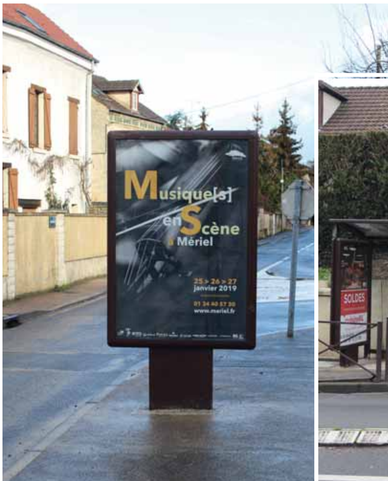
La ville dispose de faces des panneaux publicitaires pour sa communication culturelle.